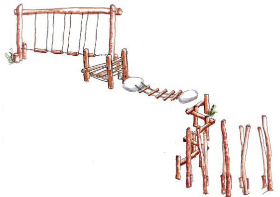
Ons nieuwe speeltoestel!